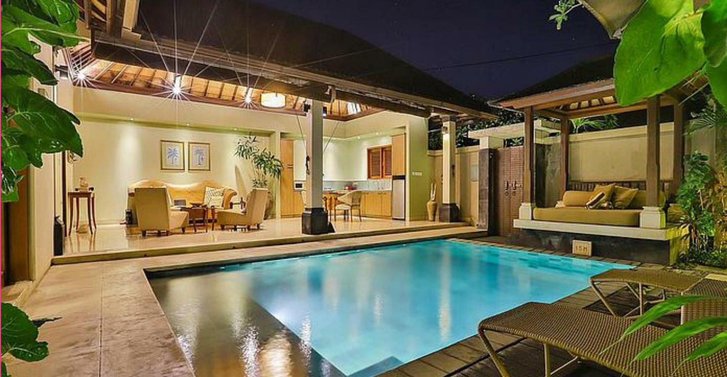
Site Démo - Cabane du paresseux - Carcans-Maubuisson